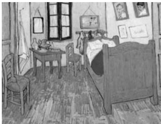
El dormitorio en Arlés. Van Gogh

15. ¿Cuál es el autor de la pintura Los fusilamientos del 3 de mayo ? (2 puntos) Indica las características más importantes de este autor (3 puntos).