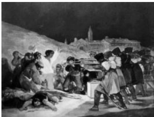
Los fusilamientos del 3 de mayo

Gráfico 2: Observa las siguientes imágenes y responde a las preguntas que se plantean a continuación. (20 puntos)