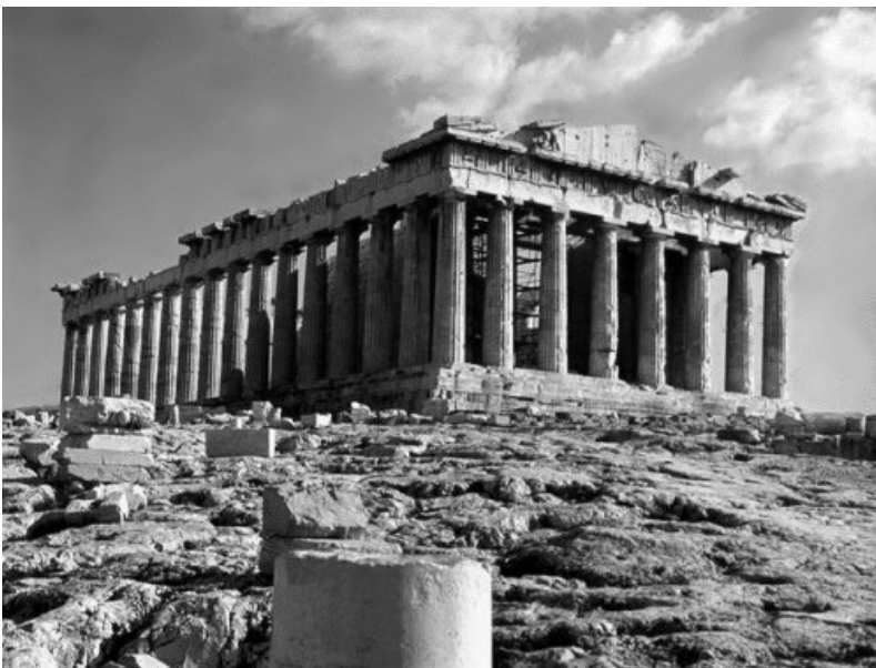
Gráfico 2: Observa las siguientes imágenes y responde a las preguntas que se plantean a continuación.

Los espacios deshabitados de la Tierra se denominan “anecúmene”. Son territorios poco favorables para el asentamiento de la vida humana, auténticos vacíos demográficos. Las razones son principalmente de carácter físico: climas muy fríos, muy secos o muy lluviosos, así como también zonas montañosas o en general poco aptas para la agricultura.