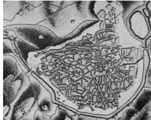
B. Plano de Toledo (España)

15. Indica qué tipo de plano urbano tiene cada ciudad (4 puntos)