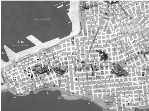
A. Plano de Montevideo (Uruguay)

Gráfico 2: Observa los planos urbanos que te presentamos a continuación y responde a las siguientes preguntas. (20 puntos)