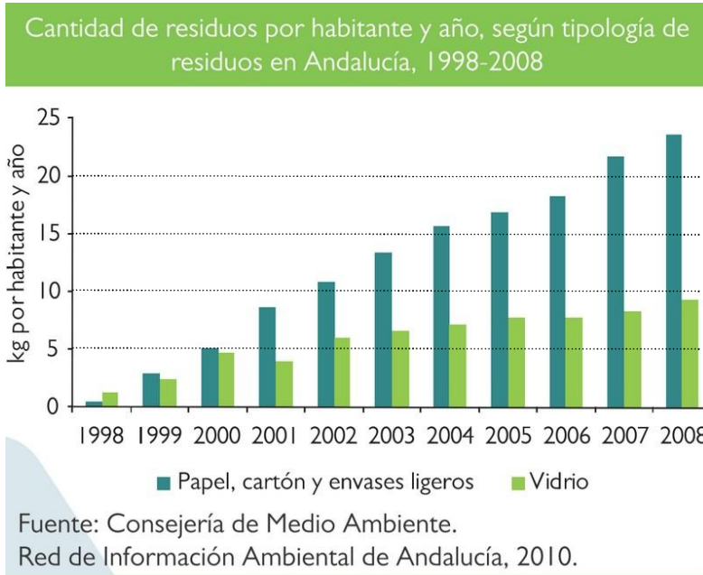
Gráfico 2. Observa el gráfico y responde a las cuestiones planteadas. (15 puntos)

10. Dibuja una gráfica de enfriamiento para el agua, con los datos que te proporciona la tabla. (5 puntos)