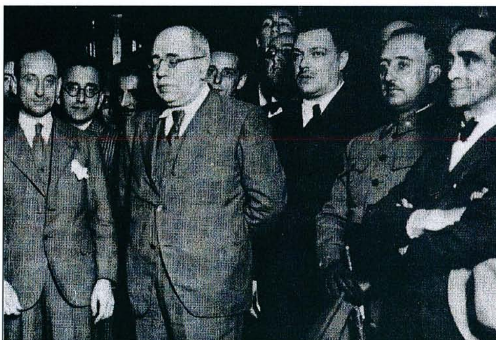
Manuel Azaña recibe un homenaje en la Coruña. A su izquierda, en un discreto segundo plano, el general Franco