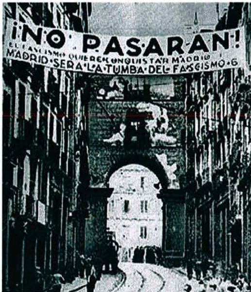
Sitio de Madrid durante la Guerra Civil