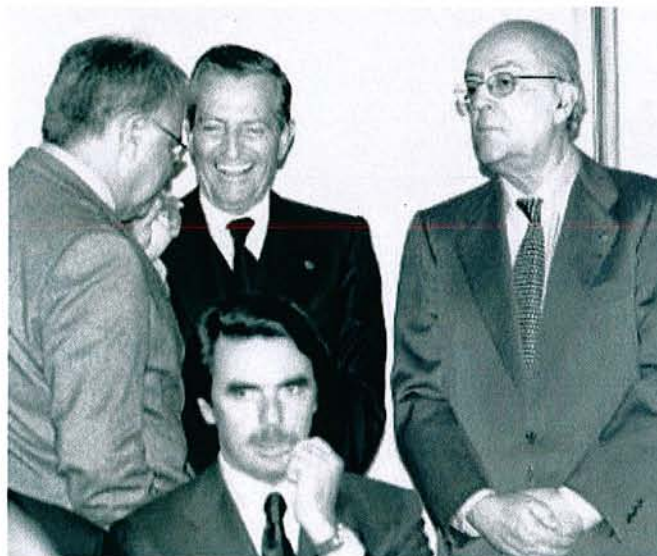
Presidentes del gobierno en la Monarquía de Juan Carlos