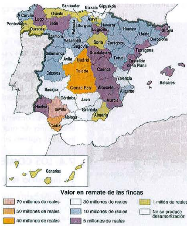
Mapa de la Desamortización de Madoz