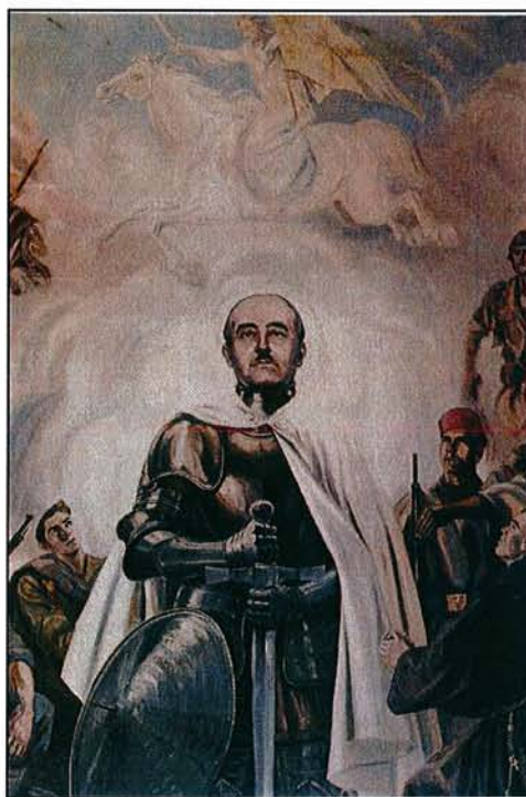
Exaltación de Franco