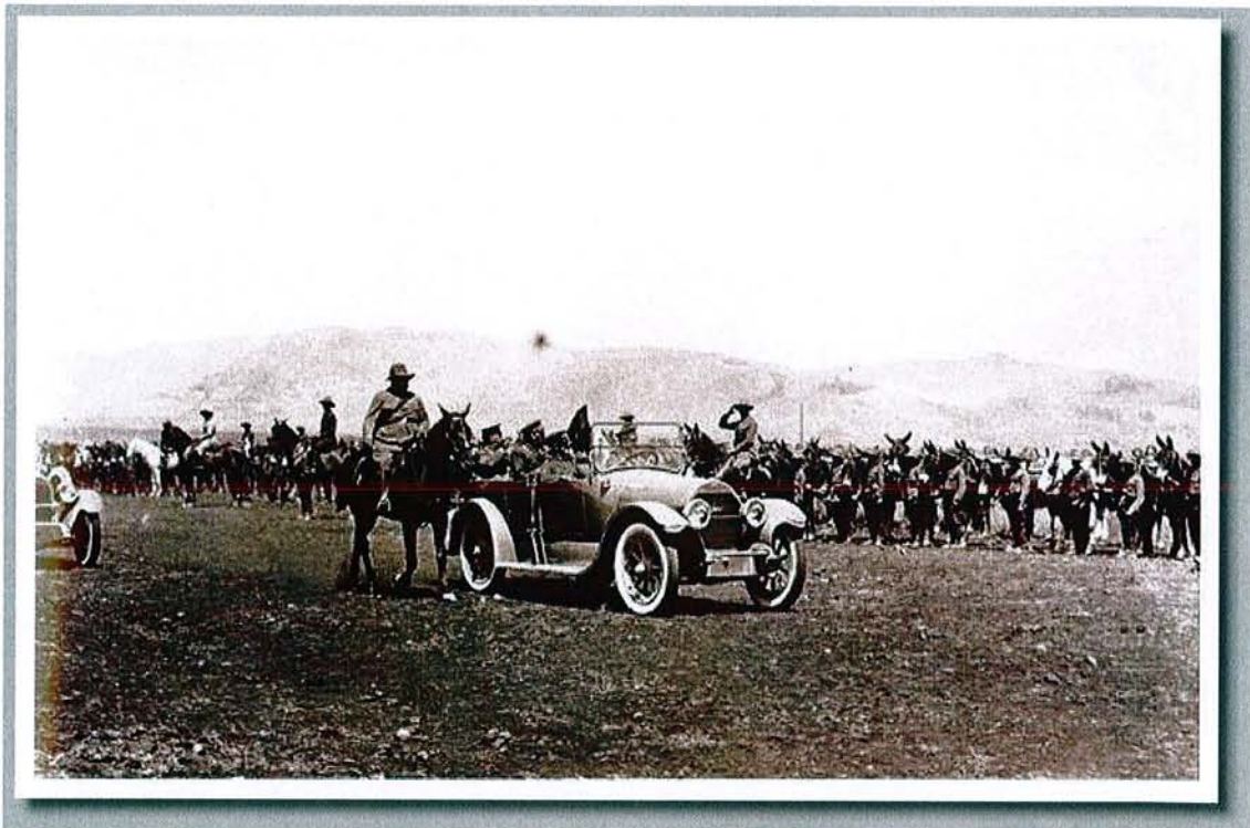
Parada militar con Primo de Rivera y Sanjurjo tras la victoria de Alhucemas en 1925.