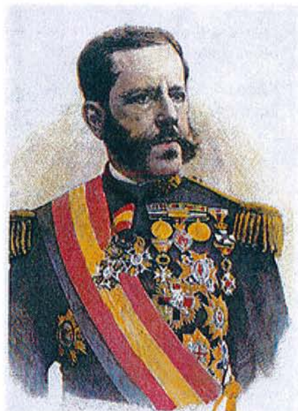
General Valeriano Weyler