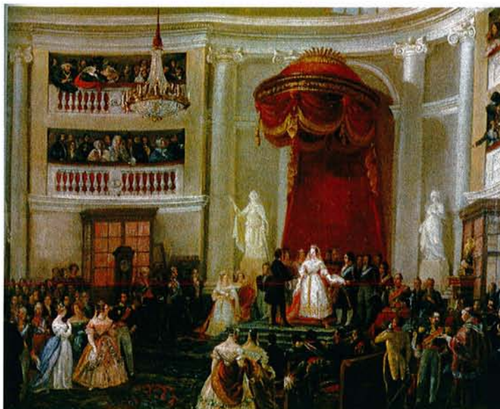
Jura de la Constitución de 1837