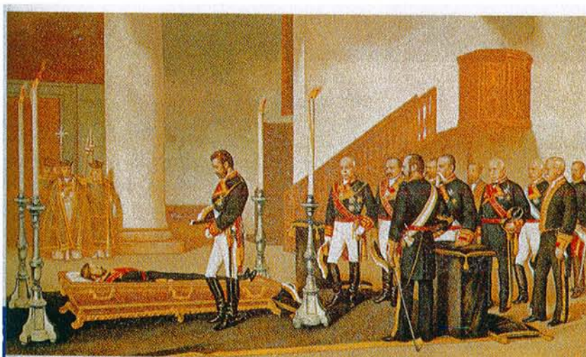
Amadeo I ante el cadáver de Prim, obra de Antonio Gisbert (1870).