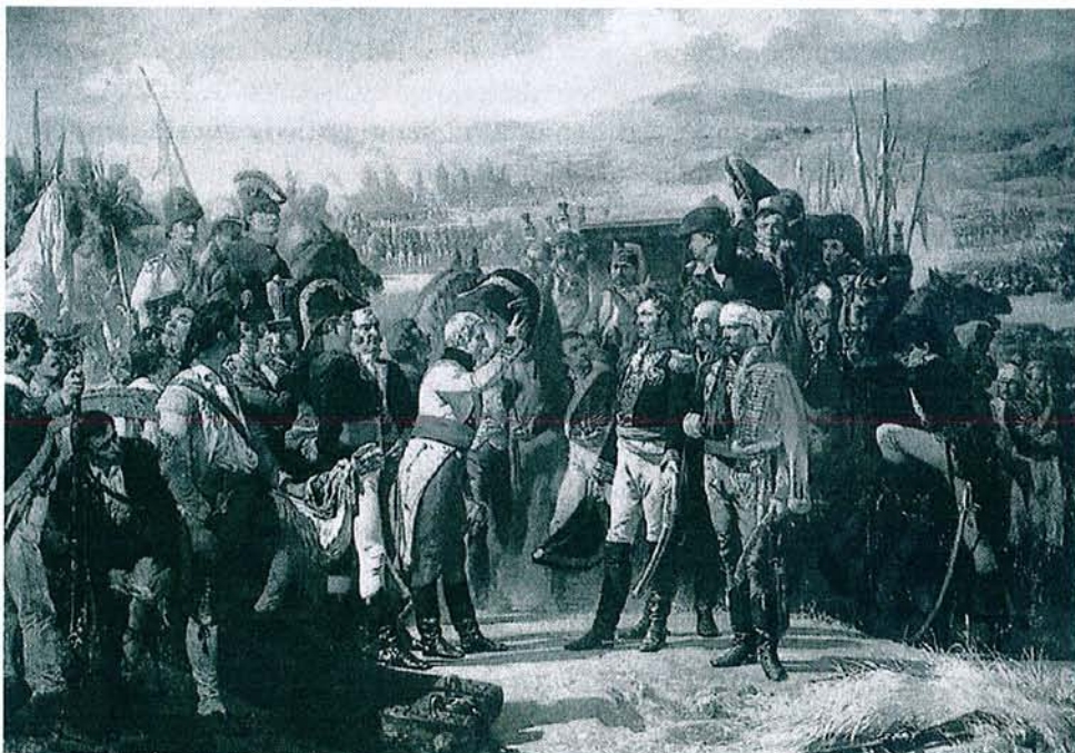
La rendición de Bailén, de Casado del Alisal.